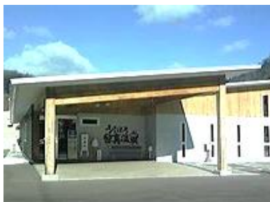
うらはろ留真温泉