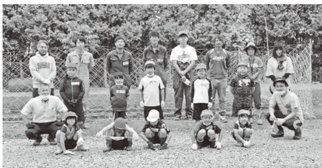
中央小で集合写真

6月10日（水）に上浦幌中央小学校で農園活動が行われました。JA青年部のみなさんと一緒にとうもろこしを植えました。今回JA青年部のみなさんと一緒に活動した学年は