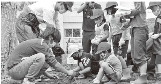
丁寧に種をまきました

6月10日（水）に上浦幌中央小学校で農園活動が行われました。JA青年部のみなさんと一緒にとうもろこしを植えました。今回JA青年部のみなさんと一緒に活動した学年は