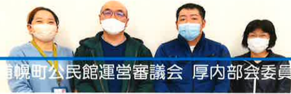
浦幌町公民館運営審議会 厚内部会委員

5月31日、第1回厚内部会を開催令和3年度利用状況の報告、令和4年度の運営の基本方針、当面の施策、営繕、サポート事業について審議していただきました。詳細は町HPをご覧ください。