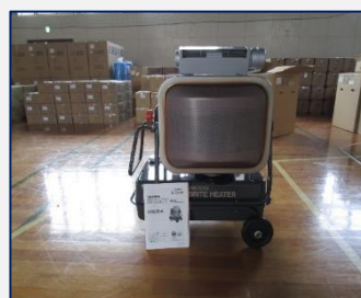
【ジェットヒーター】