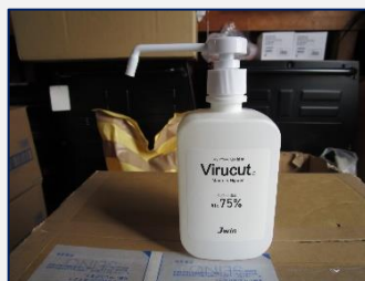
【消毒用アルコール】