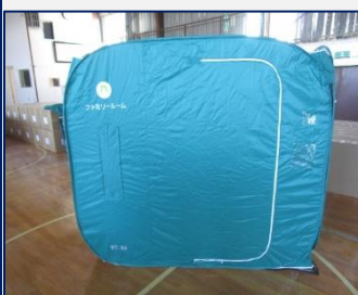
【パーティーション】