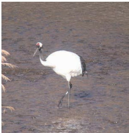
衝突事故が増加しているタンチョウ。死体などをみつけたら博物館へご連絡ください。

天然記念物は教育委員会が所管しています。もしも傷つけてしまったり、生息地を脅かす可能性のある事業の実施には、文化財保護法による届け出が必要で、詳しくは、社会教育係もしくは博物館へお問い合わせください。