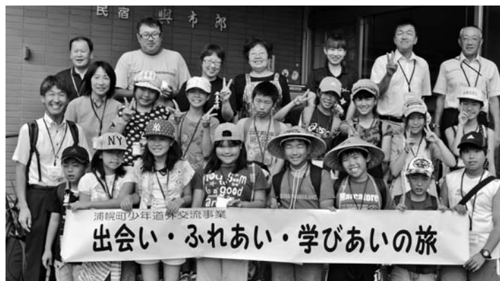
訪問 青少年道外交流で富山県を